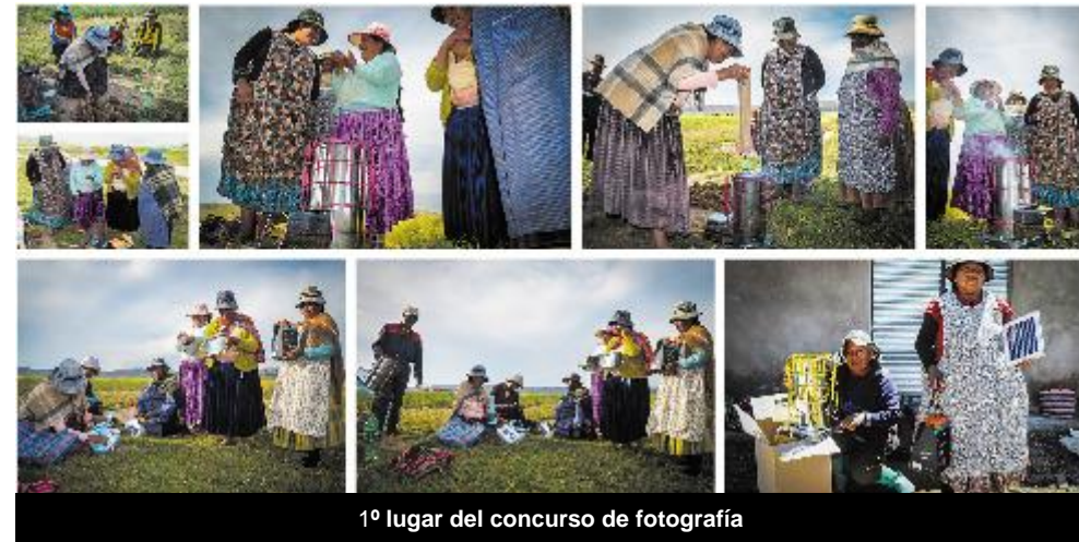
1º lugar del concurso de fotografía

Los relatos fueron evaluados por un jurado presidido por Santiago Contreras, artista formado en la Staatliche Bauhaus en Weimar. Los criterios de selección, entre otros, fueron los momentos capturados, los recursos utilizados y la manera en que cada relato cuenta la historia de sus protagonistas. Las fotografías premiadas muestran a las mujeres como miembros de su comunidad, al agua como parte esencial de la sociedad, y al uso de las tecnologías en la cooperación internacional.